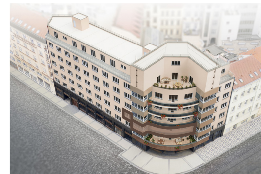
PODLAŽÍ / FLOOR

UPOZORNĚNÍ: Schéma půdorysu představuje dispoziční řešení bytu. Zobrazené vybavení nábytkem, vestavěné skříně, kuchyňská linka včetně spotřebičů a pračky nejsou součástí dodávky bytu. Toto vybavení je zobrazeno pouze pro názornost. Prodejní plocha bytu je vypočtena dle nařízení vlády č. 366/2013 Sb. Veškeré informace jakkoliv publikované v tomto dokumentu jsou nezávazné marketingové obecné povahy, které nelze vykládat jako nabídku na uzavření smlouvy ani se jich nelze dovolávat.